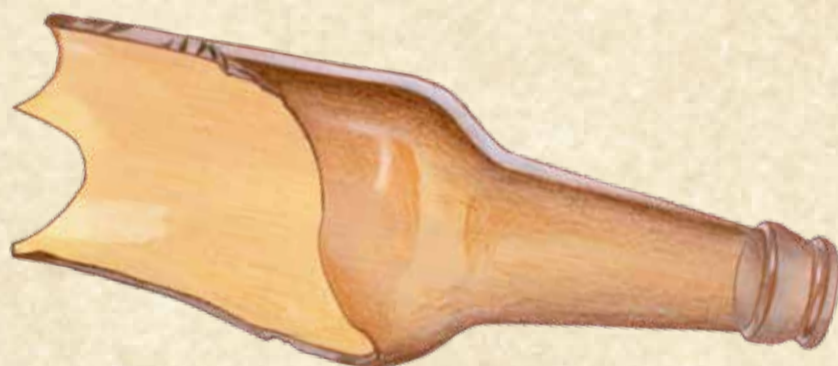
SIMPLEX AMPHORUS (Einfache Glasflasche)

An pflanzenreichen Gewässern und dicht bewachsenen Wegen, von grün bis weiß, oft mit markanter Färbung an Kopf, Bauch und Rücken. Lg. bis zu 20 cm, Flugzeit: ganzjährig.