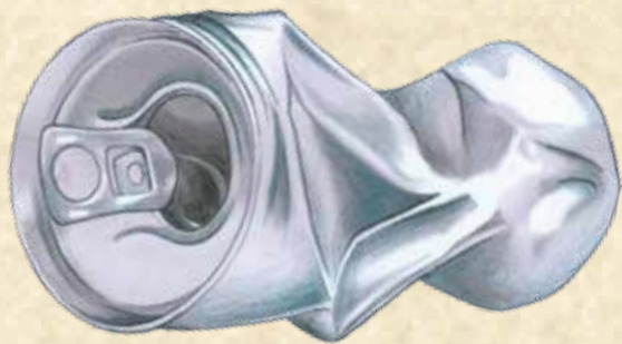
PYXIS VULGARIS (Gemeine Aludose)

Die überraschende Vielfalt in heimischen Wäldern, an Bächen und Seen