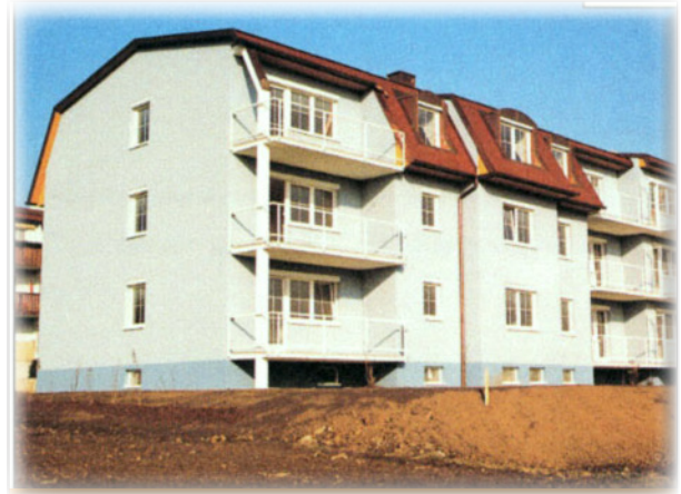
Wohnhausanlage aus Recyclingziegel

Das Ausgangsprodukt Ziegelsplitt spart sowohl Ressourcen, als auch Deponievolumen und schont die Landschaft. Gegenüber frisch gebrannten Hochlochziegeln sind die ökologischen Auswirkungen auf 1/3 reduziert.